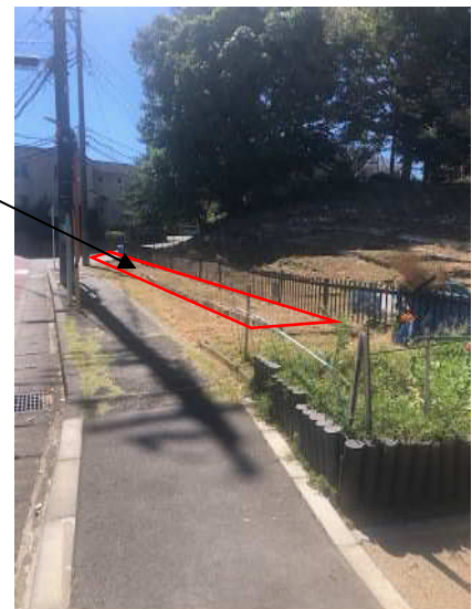
沿道を児童が花で彩ります。