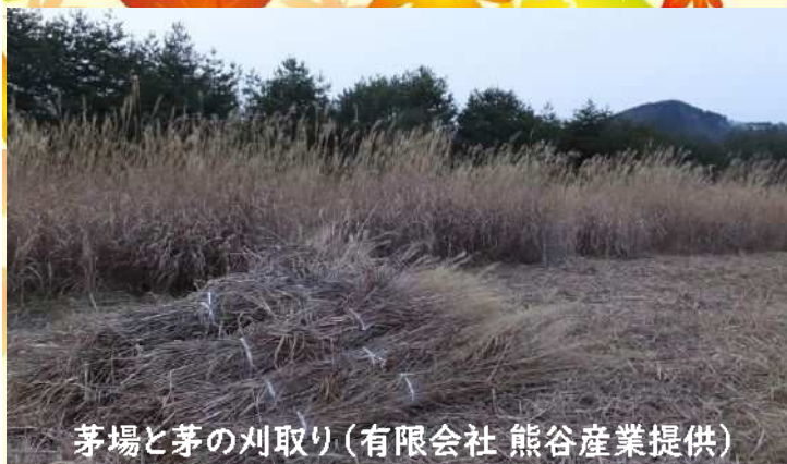
茅場と茅の刈取り