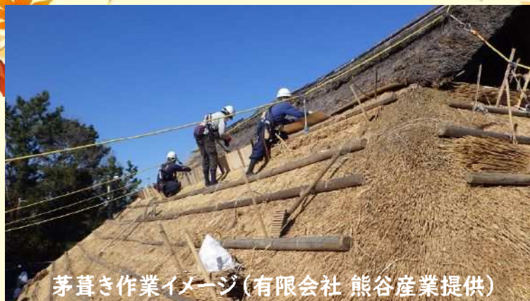
茅葺き作業イメージ