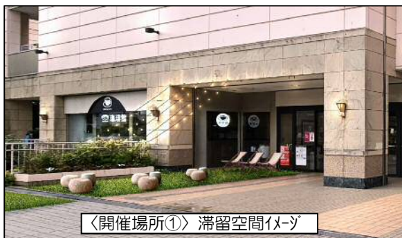
〈開催場所①〉 滞留空間イメージ