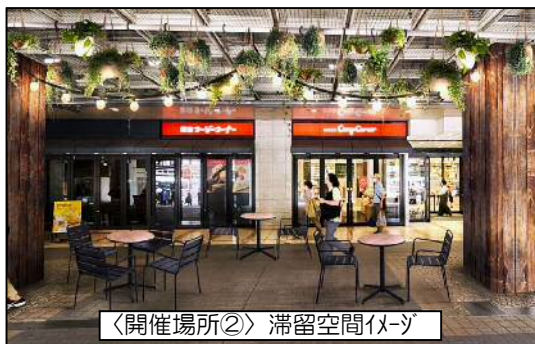
〈開催場所②〉 滞留空間イメージ

URL: https://www.city.kawasaki.jp/500/page/0000145398.html :