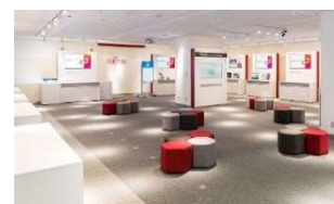
富士通テクノロジーホール（Now & Future Zone）