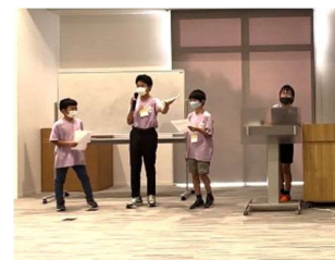
8月から10月にかけて開催された実践講座での発表の様子