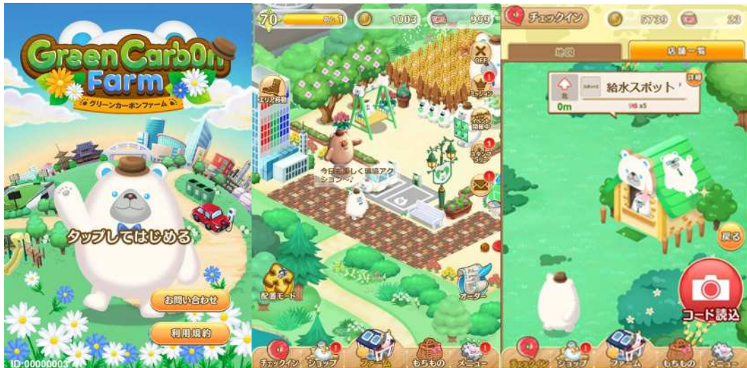
図 1 : 「Green Carb0n Farm」のイメージ