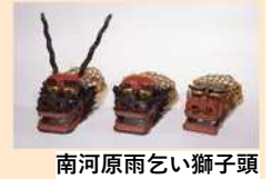
南河原雨乞い獅子頭