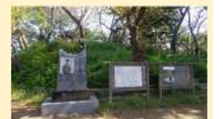
加瀬台古墳群9号墳