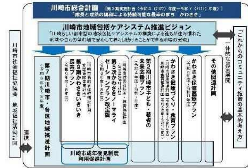
※図2「第7期川崎市地域福祉計画の位置付けと関連個別計画の関係性」

・「地域包括ケアシステム推進ビジョン」との関係では、 福祉に関する上位計画 としての位置づけに鑑み、推進ビジョンとの関連性を強め、地域課題の解決を図るために、住民の視点から地域福祉を推進していくための行政計画の1つとして、地域福祉計画を策定する。 ※図2参照