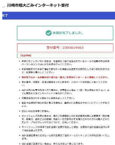
決済完了画面イメージ