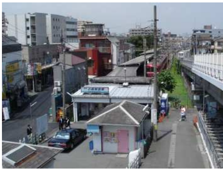
小島新田駅 (平成20年頃撮影)