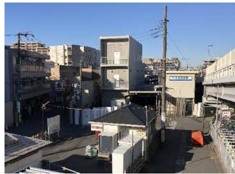
現在の小島新田駅（右側は仮設駅舎） (令和6年1月17日撮影)