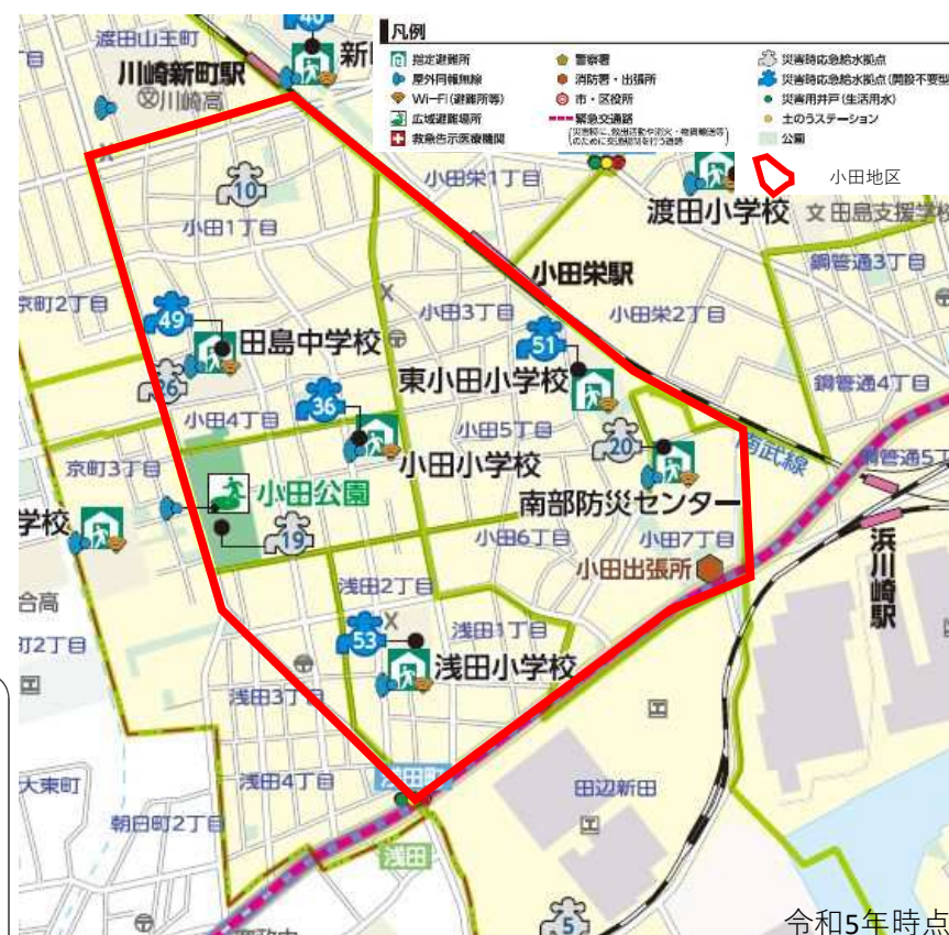
川崎市防災マップ（川崎市）より抜粋