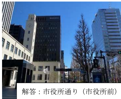
解答：市役所通り（市役所前）