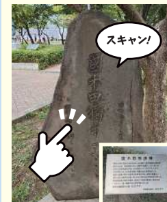
国木田独歩の碑説明看板

溝口南公園に向かう大山小径にある「大山小径」石の看板をスキャン！ 川崎市高津区溝口3-10-3