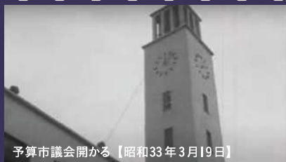
予算市議会開かる【昭和33年3月19日】