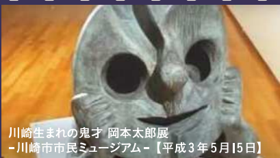
川崎生まれの鬼才 岡本太郎展 -川崎市市民ミュージアム-【平成3年5月15日】