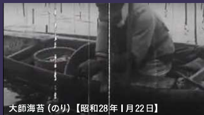
大師海苔(のり)【昭和28年1月22日】