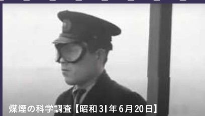
煤煙の科学調査【昭和31年6月20日】