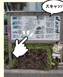
大山街道案内看板

第1回人間国宝で、溝口に生まれ、幼少の一時を過ごした濱田庄司の石碑をスキャン！ (案内板もスキャンできます) 川崎市高津区溝口2-3-12