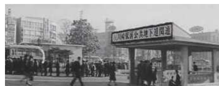
上映会では、約 30 本のアーカイブ映像を上映します。