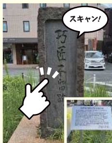
「陶芸家 濱田庄司」生誕の地案内看板