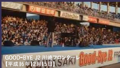
GOOD-BYE J2 川崎フロンターレ 【平成16年12月15日】