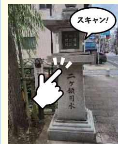
二ヶ領用水と大石橋

栄橋交差点の南東角に設けられた大山街道の案内板をスキャン！ 川崎市高津区溝口2-6