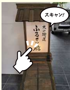
大山街道ふるさと館行燈

大山街道と二ヶ領用水の交差にかかる大石橋の石灯籠をスキャン！ 川崎市高津区溝口3-12