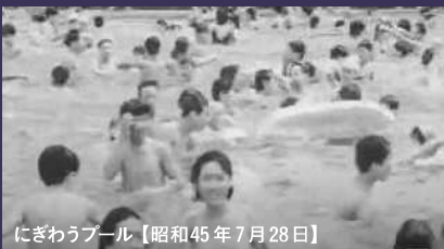
にぎわうプール【昭和45年7月28日】