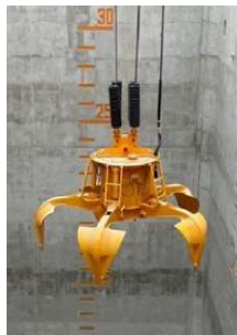
ごみクレーン （ごみクレーンバケット）