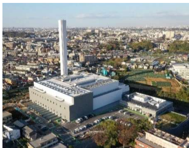
橋処理センター（上空写真）