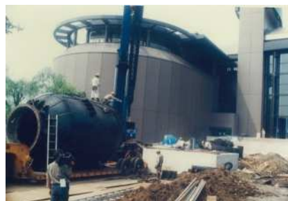
トーマス転炉の設置作業

〒211-0052 川崎市中原区等々力1-2 武蔵小杉駅北口1番乗り場からバスで約9分 「市民ミュージアム前」下車