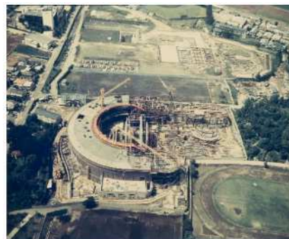
建設中の川崎市市民ミュージアム