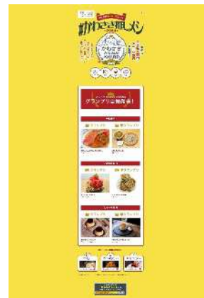
「かわさき AKINAI AWARD」 公式ホームページ