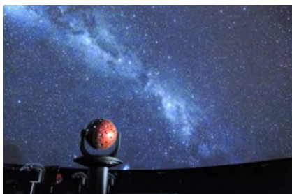
科学館のプラネタリウム MEGASTAR-III FUSION