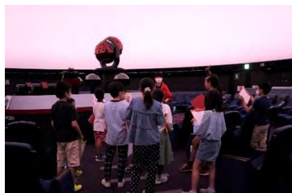
プラネタリウムの仕組みについて学ぶ 子どもたち