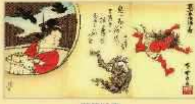
河鍋晩斎 集画面語之内