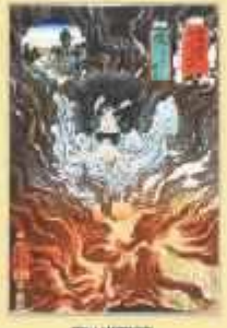
歌川国芳 木曾街道六十九次之内 蔵