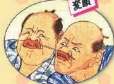
歌川広重 狂戯芸づくし 四 (部分)