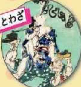
河鍋晩斎 狂斎百圓 ていしゆをしりにしく (部分)