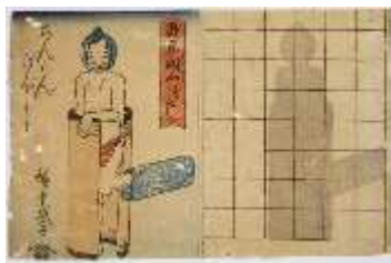
うたがわひろしげ 歌川広重 そっきょうがぼし 「即興図両づくし らんかんぎぼし」