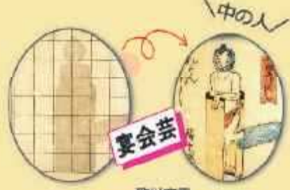
歌川広重 即興圓両づくし らんかんぎぼし (部分)