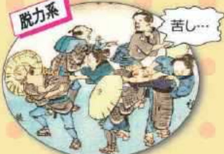
歌川広重 東海道五十三次船見回会 戸塚 (部分)