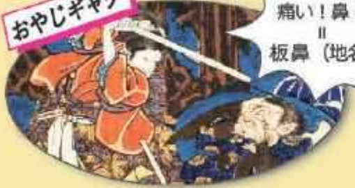
歌川国芳 木曾街道六十九次之内 板鼻 (部分)