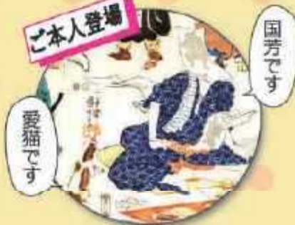
歌川国芳 流行達都給希代稀物 (部分)