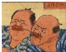
うたがわひろしげ 歌川広重 たわけい 「狂戯芸づくし 四」(部分)