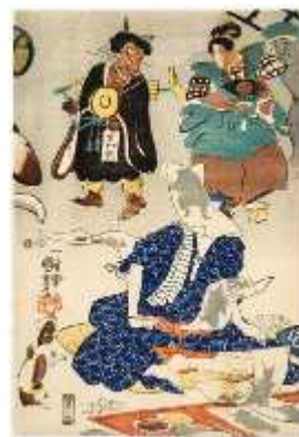
うたがわくによし 歌川国芳 ときにおうつえきたいのまれもの 「流行逢都絵希代稀物」(部分)