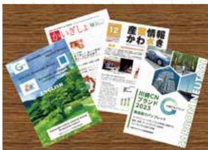
各種広報誌等に掲載