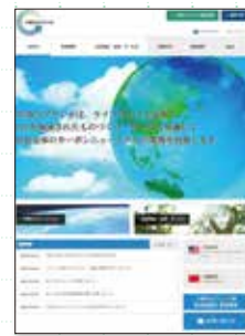
ホームページでの広報