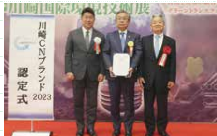
足立会長、川崎市長より認定証、楯がそれぞれ授与されました