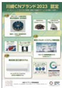
認定製品等のポスター作成