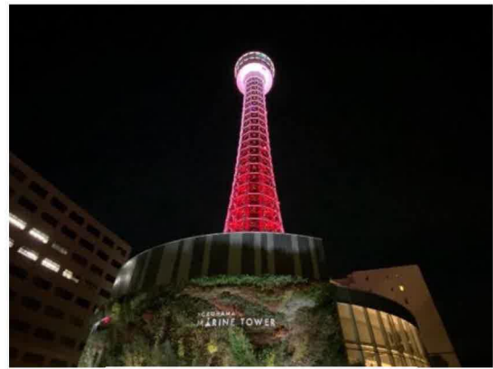
▲横浜マリントワー