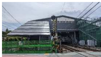
自由通路北側（工事中）