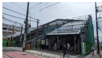
自由通路南側（使用中）