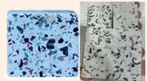
「Z.E.R.O.」を使用したレンガ