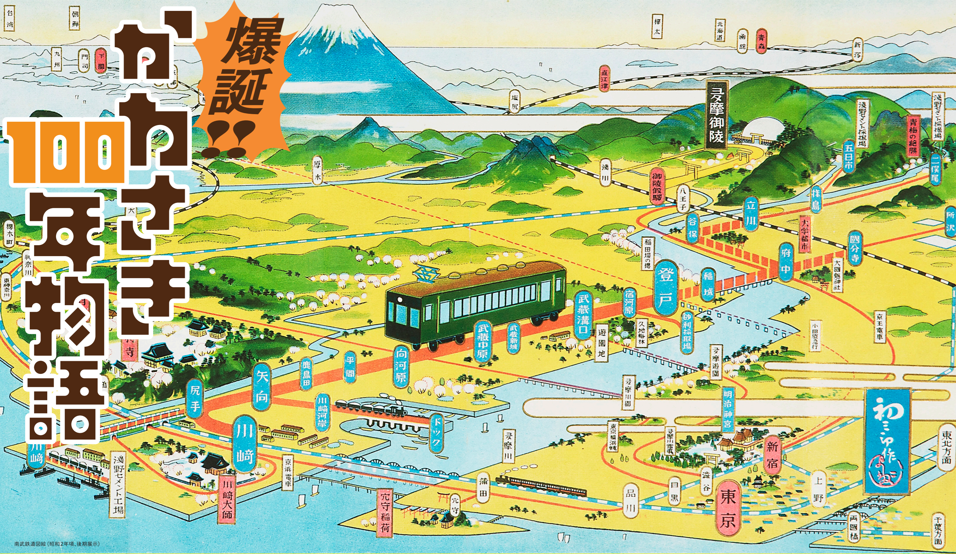
南武鉄道図絵 (昭和2年頃、後期展示)

【前期】 2024 10/11 (金) ~ 12/13 (金) 【開場時間】 9:00~17:00 (最終入場は16:30) 【観覧料】 無料