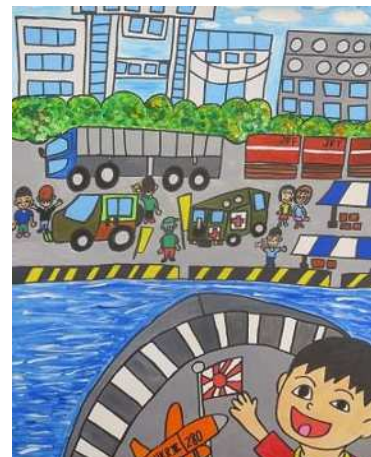
昨年度金賞作品(児童絵画の部)