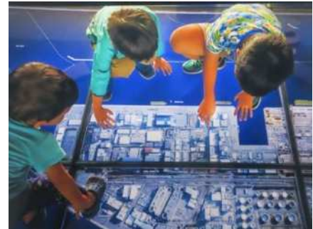
昨年度金賞作品(写真の部)