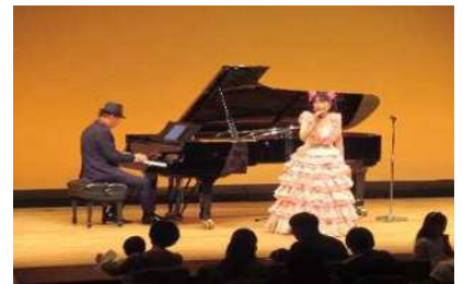
オープニングコンサートの様子（令和5年度）

2 会場 高津市民館 11F・12F （川崎市高津区溝口1-4-1 ノクティプラザ2）