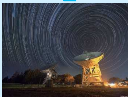
国立天文台水沢の様子

NHKのサイエンスZERO など、TV出演も豊富な 本間希樹先生に史上初め てブラックホールを写真 にとらえた画期的な方法 や、ブラックホールの正 体など、わかりやすく説 明してもらいます!