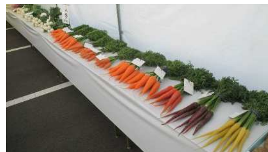
展示されている出品物（花き・野菜）