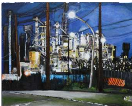
市制 100 周年特別賞 《私の原点》 たき さちこ 瀧 佐智子