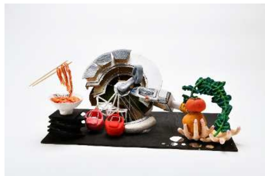
市制 100 周年特別賞 《百輪車》 いいくさ ゆら 飯草 結来(東海大学付属相模高等学校)