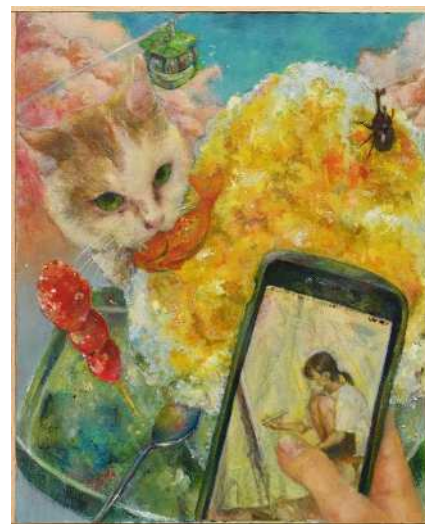
コミュゼ川崎大賞 かさはら 《私》笠原 さくら