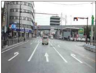
国道409号（小杉御殿町交差点） 右左折レーンの新設

後期 については、後期 の進捗状況や後期 の基本的な考え方に基づき、新規工区の着手時期を見極めながら、事業中の工区へ予算を集中投資するなどにより重点化を図ります。