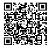
▲ 市 HP 専用フォーム

〒210-8577 川崎市川崎区宮本町 1 番地川崎市役所本庁舎 17 階 川崎市建設緑政局総務部企画課