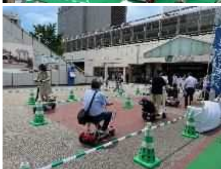
イベント開催イメージ

川崎市では、令和 7 年 11 月 25 日（火）から令和 8 年 2 月 28 日（土）まで橘公園（高津区）を活用し、モビリティステーション※の実証実験を進めております。