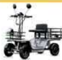
エレカーゴ (ELEMos合同会社)