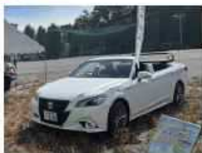
オープンカーで記念撮影