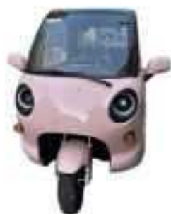
3RUOTA (EVジェネシス株式会社)