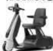
C+walk S (株式会社アットヨコハマ)