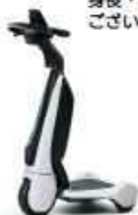
C+walk T (株式会社アットヨコハマ)