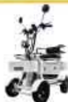
エレポーター (ELEMos合同会社)