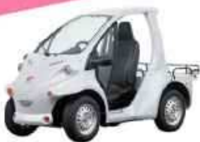
COMS (株式会社アットヨコハマ)