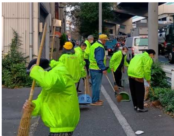
【ブルズンを着用しての街路樹での清掃活動】