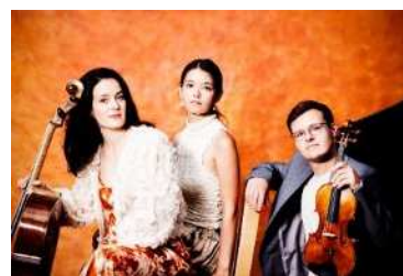
アクツィオ・ピアノ・トリオ