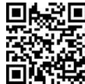
市ホームページのフォーム