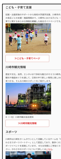
川崎市情報提供ページ「川崎市のべんり帳」画面（抜粋）