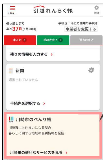
引越れんらく帳「マイページ」画面

「川崎市のべんり帳」は本市への転入予定者（市内転居を含む）に、 必要な手続を円滑に実施していただく とともに、 川崎市への関心や愛着を持っていただく契機 とすることを目的に、本市と株式会社 NTT データ及び TEPCO i-フロンティアズ株式会社が連携し、開設したもので、この「引越れんらく帳」において、自治体に関する情報提供ページを開設する取組は、 本市が全国で初めての事例 となります。