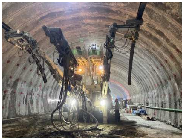
【山岳トンネル部施工状況写真】