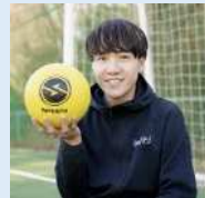
フリースタイルフットボーラー

サッカーのテクニック専門サッカースクール「OMA塾」でメインコーチを務め、子供たちに技術を指導している。