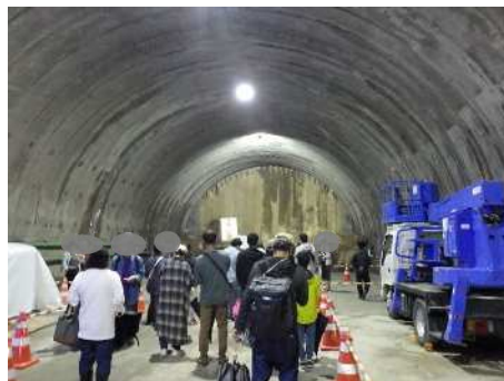
トンネル内部の様子