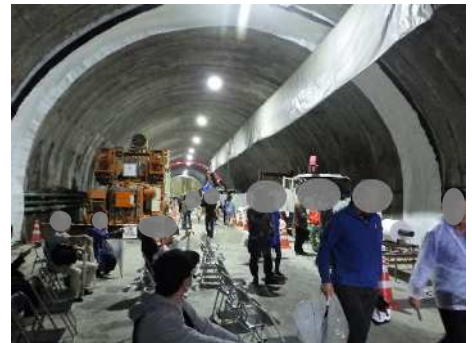
トンネル内部の様子