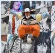
フリースタイルフットボーラー