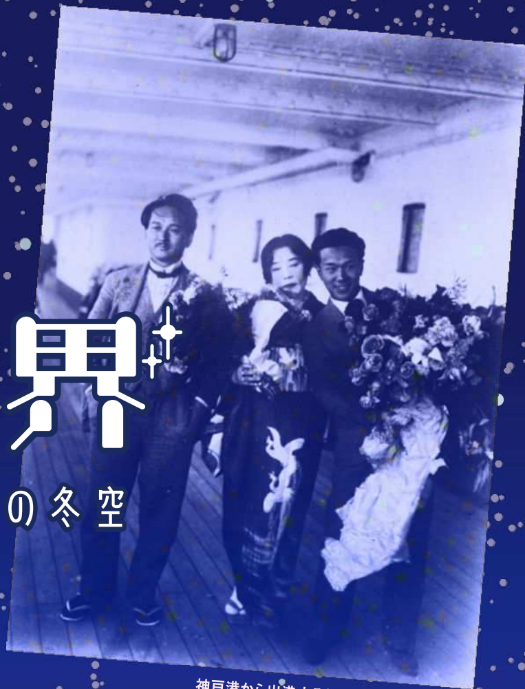
神戸港から出港する船の船上にて 1929 年