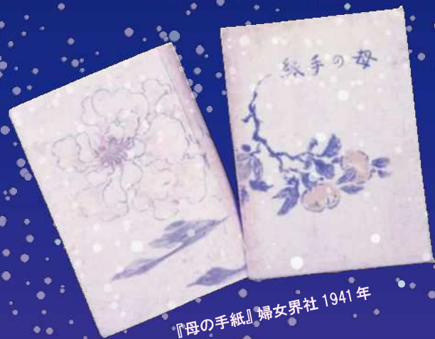
『母の手紙』婦女界社 1941 年

✦ 岡本太郎美術館とかわさき そら 宙と緑の科学館のコラボレーション企画！1929 年 12 月、18 歳の太郎さんがパリに向かう通過地点で見た星空を体感する特別プログラムを上映します。当時を想像しながら、お楽しみください。✦