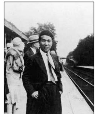
岡本太郎 (パリ郊外にて 1930年)