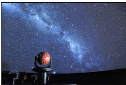
1500万個の星を映し出す メガスターⅢフュージョンの星空