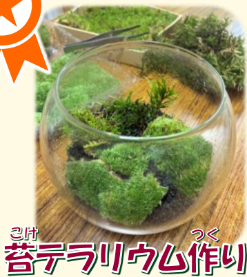
苔テラリウム作り