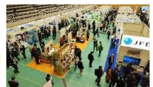
川崎国際環境技術展会場風景

「Kawasaki Eco-Tech Champ Project」の略称。 川崎国際環境技術展(Kawasaki Eco-Tech Fair)を 起点として、市場のチャンプ(Champ)となる製品・ サービスを生み出していくことをモチーフとしています。