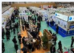
第18回川崎国際環境技術展会場

カーボンニュートラルの実現と持続可能な経済成長の両立を目指し、毎年、環境分野における優れた環境技術やノウハウを川崎から国内外に広く情報発信し、出展者・来場者の皆様の市場開拓や販路拡大、新たな人脈形成に繋がる交流の場を提供する展示会。