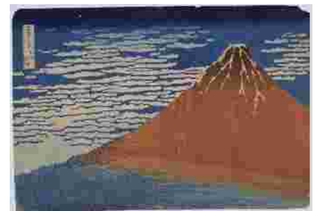
かつしかほくさい ふがくさんじゅうろっけい がいふうかいせい 葛飾北斎「富嶽三十六景 凱風快晴」