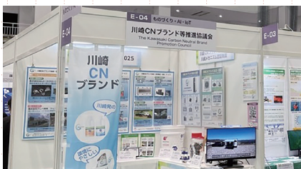
展示会への出展 (川崎国際環境技術展)