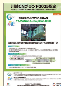
個別ポスター (2025認定YAMANAKA社)