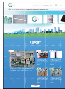
ホームページでの広報