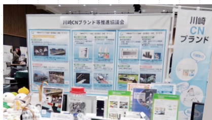
展示会への出展 (新川崎マッチング展)