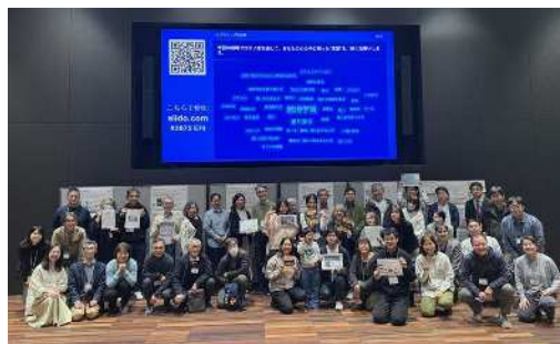
令和7年度 プロジェクト実施後の報告会での集合写真 （プロボノワーカーとサポートを受けた団体の皆さん）

32名のプロボノワーカー（運営委員を含む）がチームを組み、6団体の運営上の課題解決につながる活動を行いました。