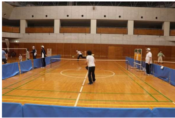
ピックルボール テニス×卓球×バドミントンの ラケットスポーツ