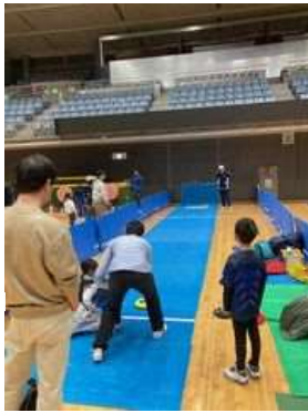
カローリング ポイントゾーン を狙って滑らせよう!