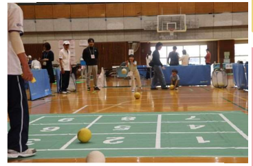
スリーアイズ 1~9のマスのボールを 入れて得点を競おう!