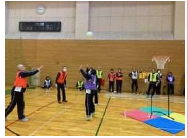
セストシューター 厚木市で誕生! シュートゾーンから 得点を狙おう!