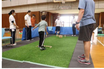
モルック 木の棒を投げピンを倒そう!