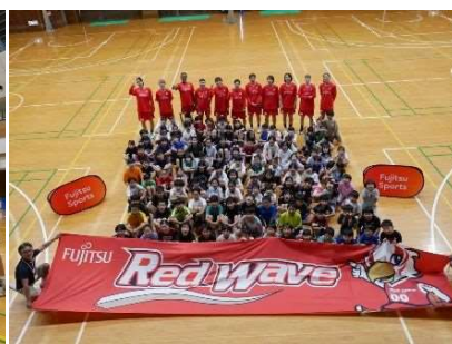
練習後には選手への質問コーナーや記 念写真撮影などの交流があります。

取材を希望される場合は、7月24日(金)17時まで に問合せ先まで御連絡ください。