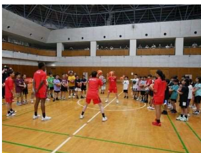
選手によるデモンストレーションを間近で見て技術を学びます。