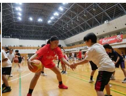
ドリブル・パス・シュートなどの技術を選 手から教えてもらいます。 応用コースではゲーム形式の実践的な 練習も行います。