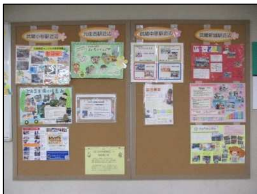
保育所等の情報提示【中原区】

各区役所では、利用案内の説明会や、入所保留となった児童の保護者へのアフターフォロー等を通じて、保護者の保育ニーズを確認しながら、市の保育施設・サービスとのマッチングを図るとともに、子育てに係る様々な情報提供を行っています。