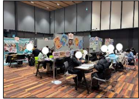
一般向けの就職相談会