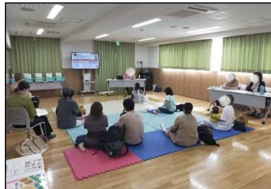
事前説明会の様子【宮前区】