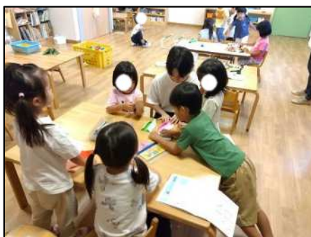
高校生保育士おしごと体験