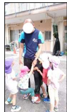
潜在保育士等対象の 保育士体験