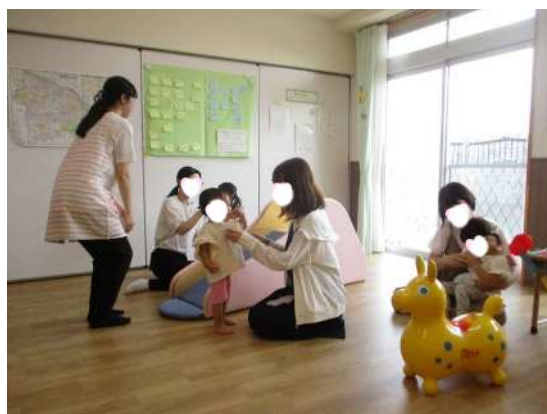
多摩区保育・子育て総合支援センターでの様子

保育・子育て総合支援センターや区保育総合支援担当、公立保育所の保育士・栄養士・看護師が民間保育所等への支援や人材育成及び地域の子ども・子育て支援、保育所機能の強化を図り、効果的・効率的な保育の実施や子育て支援を展開しました。