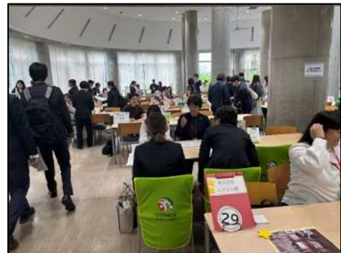
保育士養成施設との連携事業