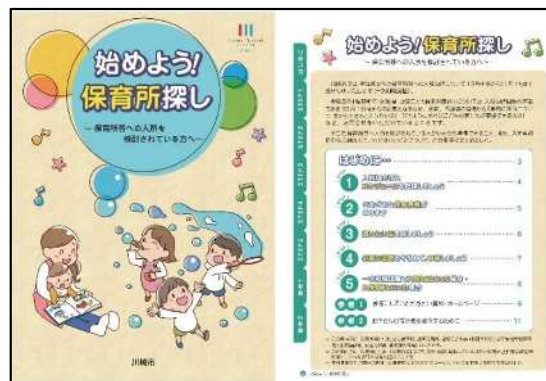
パンフレット「始めよう！保育所探し」