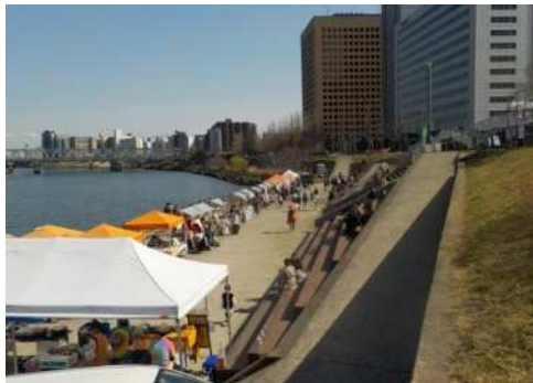
過年度の社会実験で実施したイベントの様子