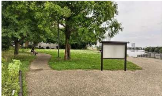
多摩川見晴らし公園の様子