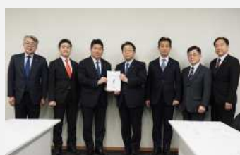
公明党(令和7年12月24日)