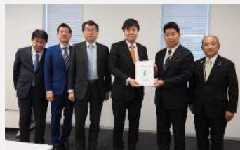
立憲民主党(令和7年12月11日)