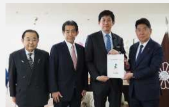
自由民主党(令和7年12月12日)