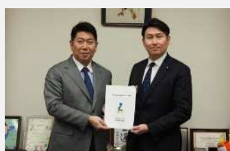
日本維新の会(令和7年12月25日)