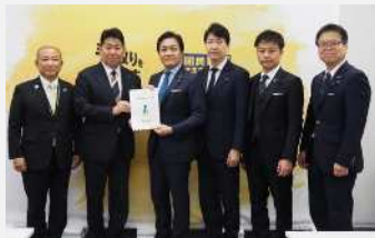
国民民主党(令和7年12月11日)