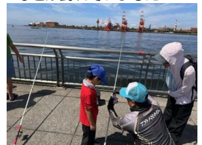
前回の釣り教室の様子 東扇島