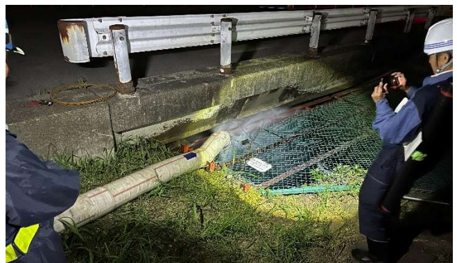
【排水ポンプ運転(排水作業)訓練】