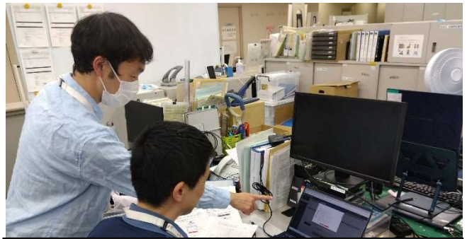
【メールニュース配信訓練】 (川崎市役所南庁舎)