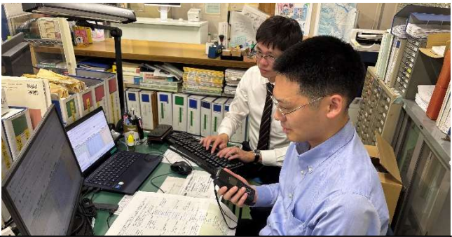
【連絡記録(情報共有)訓練】 (中部下水道事務所)