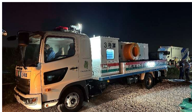
【排水ポンプ車配置訓練】