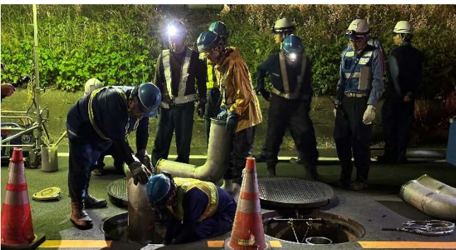
【L型管接続訓練(河川側)】