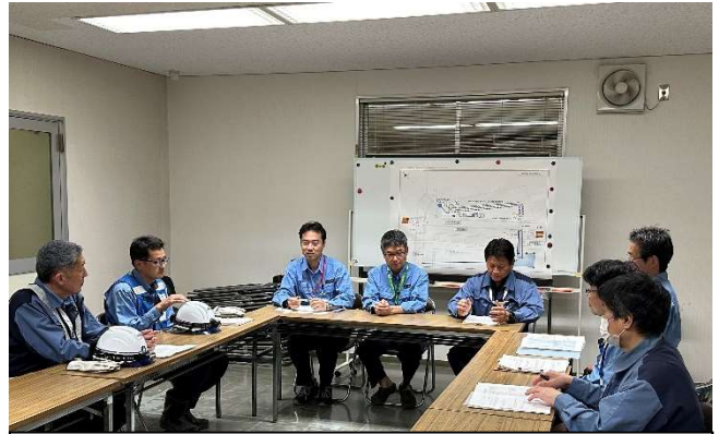
【班長ミーティング】 (中部下水道事務所)