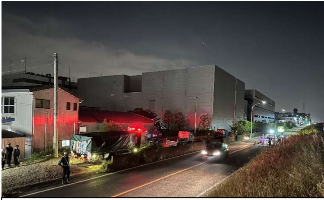
【訓練全景】 (中原区宮内1丁目26付近)