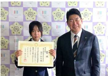
前年度に市長賞を受賞した 南加瀬中学校での表彰式の様子