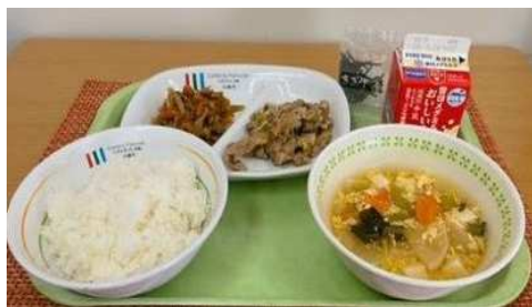
前年度の市長賞受賞献立