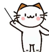
危機管理本部 防災キャラクター ニャビ先生