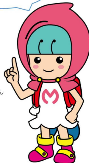
危機管理本部 防災キャラクター 防災マスター(見習い) マナビー