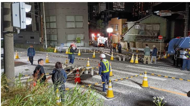
【訓練全景】 (中原区上丸子山王町1-1347付近)