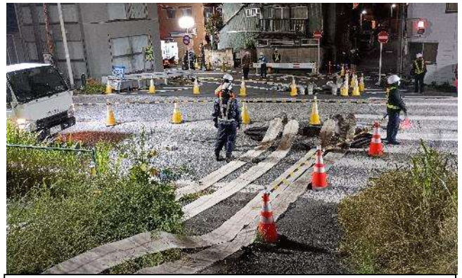
【排水ホース設置完了】 (河川側)