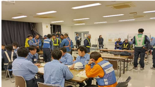
【班員ミーティング】 (等々力水処理センター)