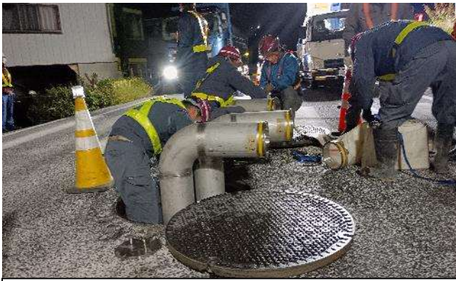
【L型管接続訓練】 (河川側)