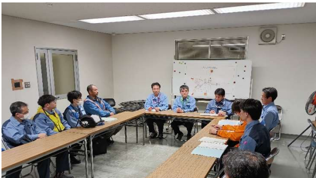
【班長ミーティング】 (中部下水道事務所)