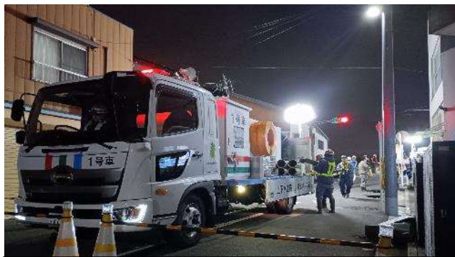
【排水ポンプ車配置訓練】 (中原区上丸子山王町1-1347付近)