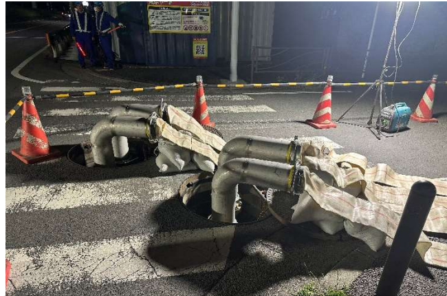
【排水ホース敷設訓練】 (高津区宇奈根608付近)