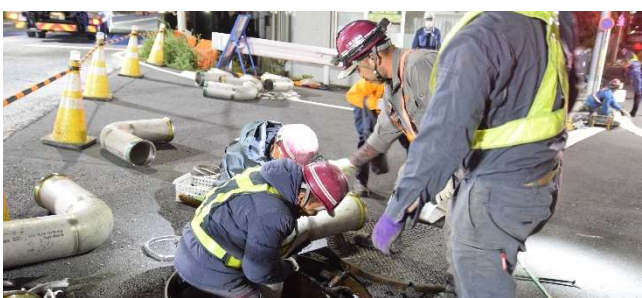
【L型管接続訓練】 (内陸側)