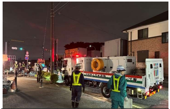
【排水ポンプ車配置訓練】 (高津区宇奈根608付近)