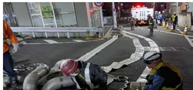
【排水ホース敷設訓練】 (内陸側)