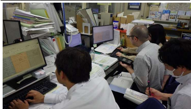
【連絡記録（情報共有）訓練】 (中部下水道事務所)