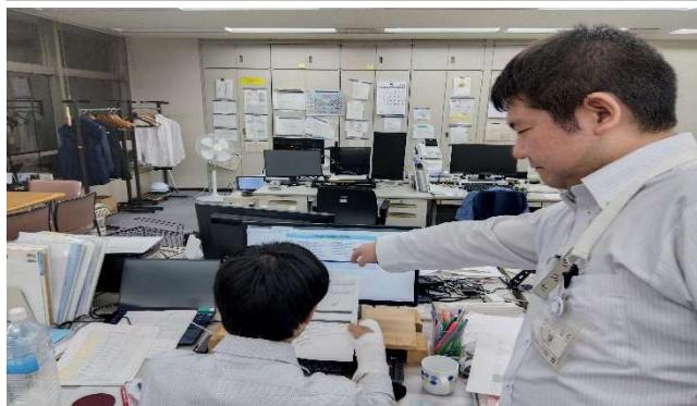
【メールニュース配信訓練】 (川崎市役所南庁舎)