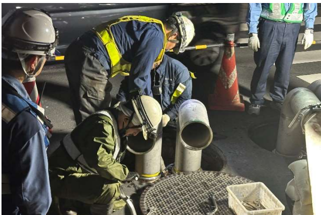
【L型管接続訓練】 (河川側)