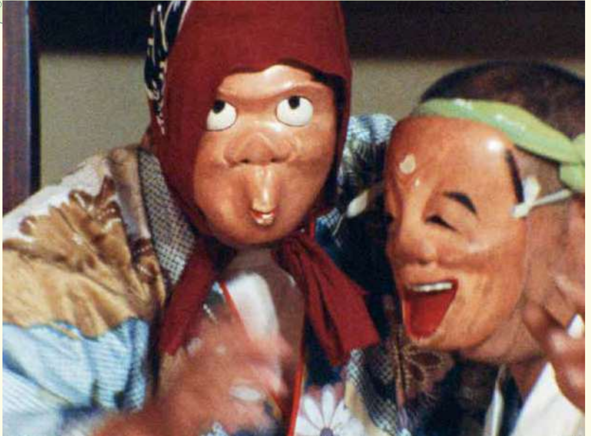
ふるさとあさおシリーズより①, ②, ③『石仏は語る』④, ⑤『時を越えて 麻生に伝わる郷土芸能』