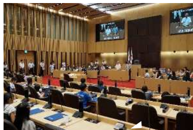
正副議長質問タイム