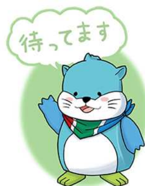
「議会かわさき」広報キャラクター およん

問合せ先 川崎市議会 議会局広報・報道担当 落合 電話：044（200）3364（内線53303）